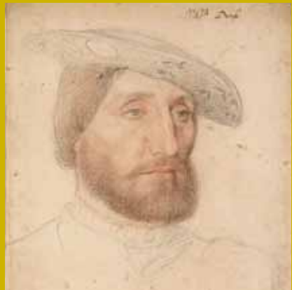
Claude d'Urfé, dessin de CLOUET Jean (école de), intitulé Claude d'Urfé et réalisé au 16 e siècle, conservé au musée Condé de Chantilly, sous le numéro d'inventaire DE MN 231 ; B 70.

Au 16 e siècle, le bâtisseur du château, Claude d'Urfé (1501-1558), est bien connu à la cour de France : il est au service de François I er puis d'Henri II. Voyageur infatigable, il participe aux campagnes d'Italie et représente le souverain français au Concile de Trente et auprès du Pape à Rome (1546-1551). Sous le règne d'Henri II et jusqu'à sa mort, il exerce la charge de gouverneur du Dauphin.