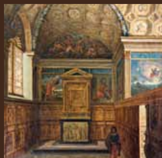
Giuseppe Uberti, Intérieur de la chapelle du château de la Bâtie d'Urfé (1880), huile sur toile, Musée d'art moderne de Saint-Étienne Métropole, dépôt au château de la Bâtie d'Urfé.

Les peintures sont signées Girolamo Siciolante, connu pour plusieurs réalisations Renaissance à Rome. Des boiseries et marqueteries, aujourd'hui au Metropolitan Museum de New York, recouvraient les murs de la chapelle.