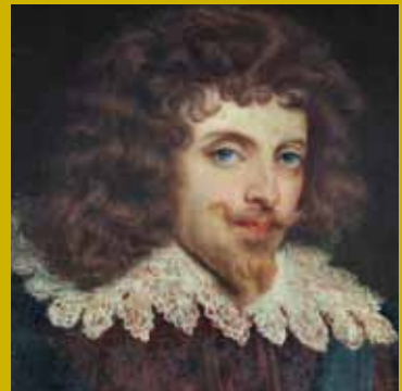
Honoré d'Urfé, huile sur toile, la Diana, dépôt au Château de la Bâtie d'Urfé

L'histoire d'Honoré d'Urfé est aussi riche en rebondissements que ses romans. Après une enfance plutôt calme dans le Forez, il connaît une existence mouvementée dans les rangs de la Ligue. Sa vie sentimentale est également tumultueuse. Amoureux de sa belle-sœur, Diane de Chateaufort, il finit par l'épouser en 1600.