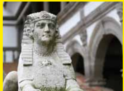
Sphinx, statue en marbre, Musée des Arts décoratifs, UCAD, Paris, dépôt au Château de la Bâtie d'Urfé

Il porte sur sa poitrine l'inscription : "Sphingem habe domi" qui peut être interprétée comme "Garde la connaissance en ta demeure".